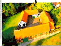
Mühle Liesebach: Erhalt eines historischen Gruppendenkmals